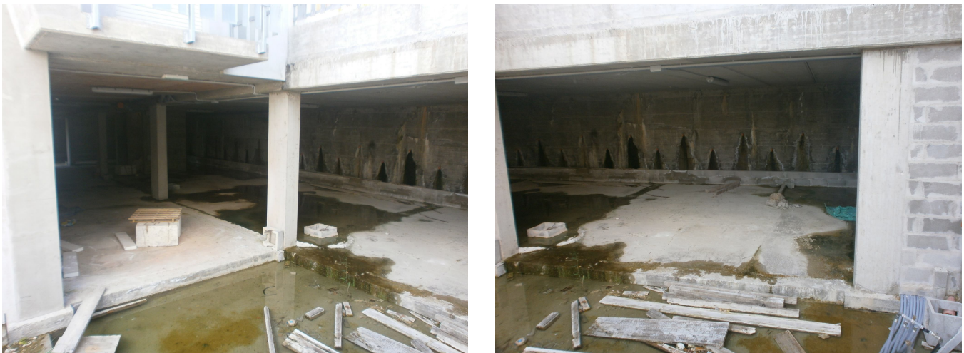
Figura 1 - Infiltrazioni al piano interrato

Il fenomeno è stato oggetto di una specifica consulenza tecnico-geologica e progettazione preliminare del drenaggio del luglio 2013.